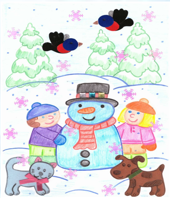
«Тиздән Яна ел» Дарина Груздева, 1 нче сыйныфы укучысы