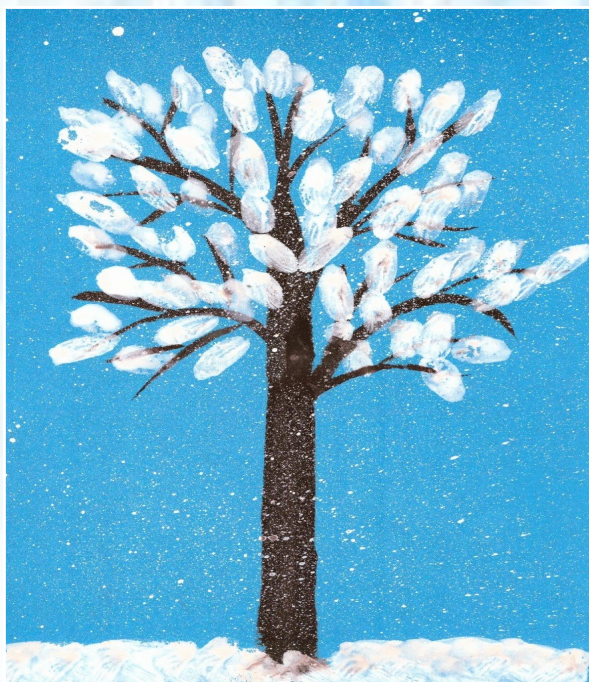
«Ак кар ява» Елизавета Житлухина, 1 нче Б сыйныфы укучысы

Ризган Заһидуллин, 5 нче Г сыйныфы укучысы