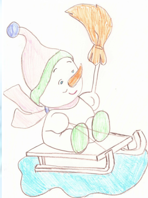
«Кар Бабай чана шуа» Наил Гарипов, 1 нче Б сыйныфы укучысы